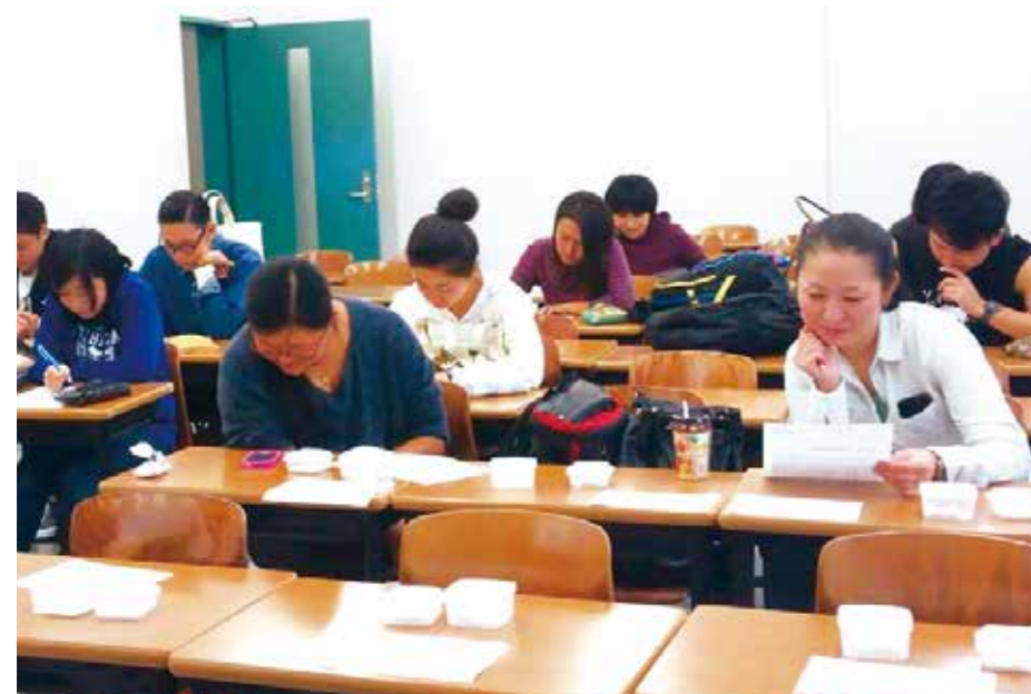
国際学部の学生からアンケート調査にご協力いただきました。(10月7、8、14日)