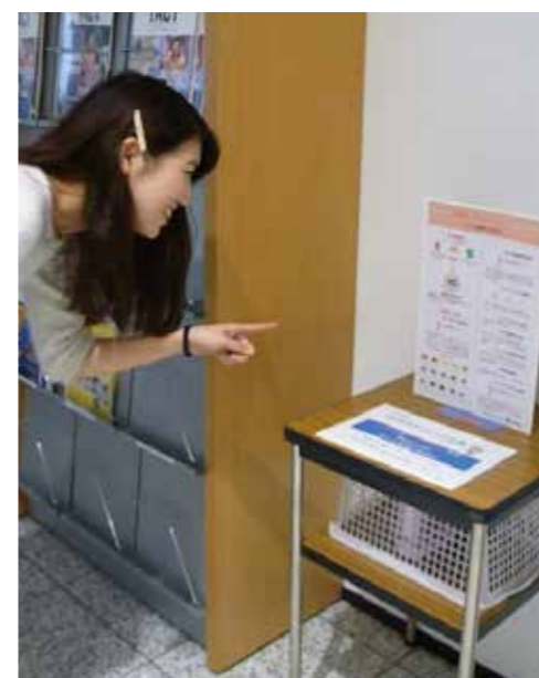
文京キャンパスでは学生ホールで「拓殖大学の香り」を提供しました。(1月22、25、26日)