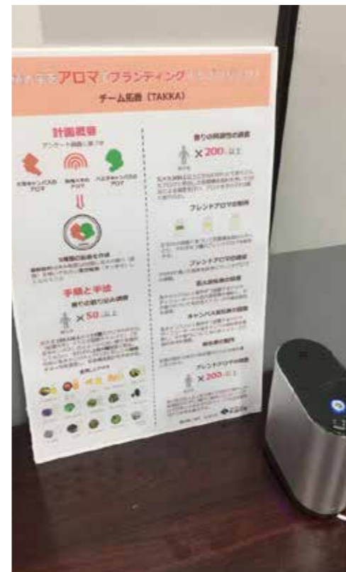
八王子国際キャンパスでは、工学部棟の1F事務室の前で「拓殖大学の香り」を提供しました。(1月22、23、25、26日)

ブランディングアロマという企画はプロジェクト学習の課題としてのスタートでしたが、実際に計画を進めることの難しさ、ブランドを作ることの大変さを実感することができ、私たちにとっても、良い体験となりました。