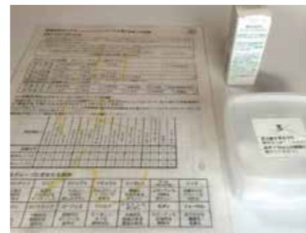
15種類の香りを用意し、アンケート調査を行いました。(10月7日～18日)

その後も計画通りには活動が進まず、予定は大幅に遅れましたが1月に八王子国際キャンパス、文京キャンパスにそれぞれ1台ずつ学生の多い場所を選んでアロマディフューザー