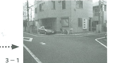
3-1 劇場通り(大通り)から1つ路地に入ったところにある三叉路。街灯が大通りに比べ少なく、昼間でも人通りがまばらで結果的に死角が多くなる。次の路地まで数十メートルしか間隔がないため、逃走が容易。