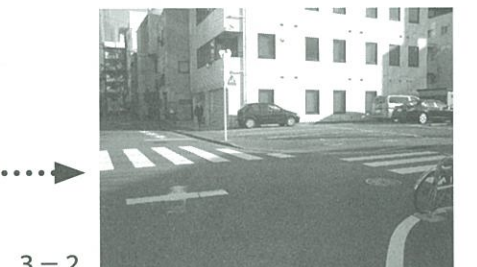
3-2 中規模の通りが南北に通っており、一方通行の路地3つが合流する五叉路。付近にはコインパーキングがあり、ひたたくり被害と同時に、車上荒らしの事例もある。昼間は付近にオフィスビルがあるため一定の人通りがあるが、夜間は人通りが少ない。五叉路という特殊な地形のため、逃走経路がもっとも多い。