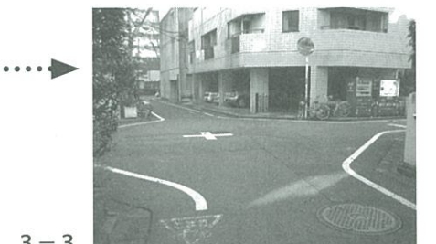
3-3 劇場通り(大通り)西側の3地点の中で、もっとも繁華街に近い。周辺はオフィスビルやマンション、ホテルなどがあり、2つの細い路地が交わる十字路である。繁華街に明るさとは対照的に、昼間でも薄暗い印象がある。写真のように両脇から樹木が張り出しており、死角が多い。