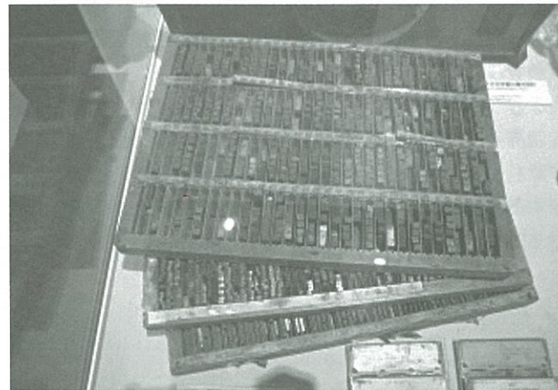
横浜JICA博物館 活版印刷 活字