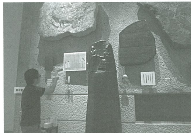
江戸川橋 印刷博物館 見学

版印刷の作業や様々な出版印刷機械、出版印刷がもたらした文化の発展を直接学びました。そして、3) 横浜JICA博物館も見学をし、写植活字の原版について詳しく知ることができました。この日本の出版印刷の文化や歴史について学んでいくうちに、これからの将来を担っていく、若い人々が様々なことに関心を持つことの重要さを感じました。現在の活字離れ、印刷・製本産業の縮小を止めることは難しいかもしれませんが、しかし若い人々が、これまで日本が歩んできた歴史にしっかりと目を向けて行くことによって、文化の記憶を継承していくことが出来き、また、様々な日本の伝統文化に直接接することができる機会をより多く作っていくことによって、出版印刷文化を継承していくことが出来ると確信しました。このインタビューや博物館見学、資料調査などによってわかったことをまとめて、紅陵祭でパネルで発表をしました。